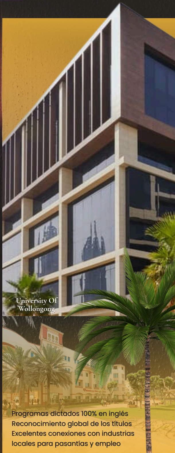
University Of Wollongong

Programas dictados 100% en inglés Reconocimiento global de los títulos Excelentes conexiones con industrias locales para pasantías y empleo